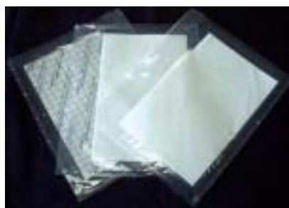
個包装パッケージ